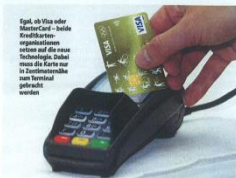
Was in London und ein paar ausgewählten Testgebieten bereits funktioniert, soll nun auch in Österreich ab 2012 starten: die Kreditkarte, die ein Zahlen ohne direkten Kontakt, also per „Near Field Communication“, erlaubt.

Wien (OTS) - Im Vorbeigehen zahlen - die Kreditkarte nur kurz zücken: Die AK lehnt die Pläne von Raiffeisen International ab, wonach die Bank ab August mit der kontaktlosen Funkchip-Kreditkarte - ohne Unterschrift und ohne PIN - an den Start gehen kann. Die Kontrolle über das Geldausgeben sehr schnell entgleiten", warnt AK Kc Bargeldloses Bezahlen ohne Schlitz und Streifen, "aber auch dem allfälligen Missbrauch von Daten wird T und Tor geöffnet."